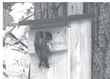
fol. J. Maziarski