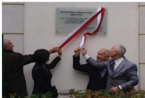
Odstąpienie tablicy poświęconej Michałowi Doliwo-Dobrowolskiemu