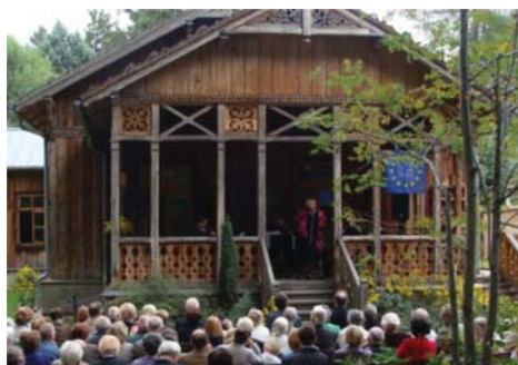
Koncert „Podkowińskie noce i dnie” w willi Aida