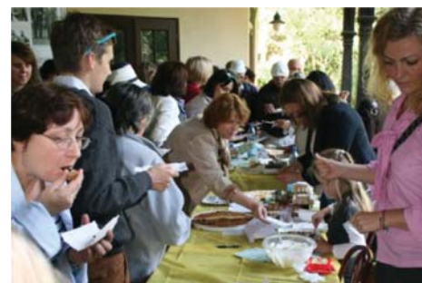
III edycja Konkursu na Produkt Lokalny