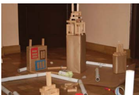
Warsztaty architektoniczne dla dzieci „Architekturka z mojego podwórka”