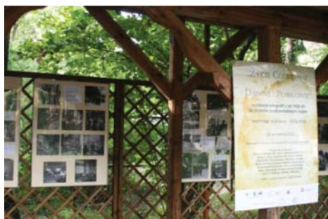
Wystawa fotografii „Życie codzienne w dawnej Podkowie 1925 -1969”