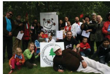
Piknik mniejszości narodowych „Podkowa bez granic”