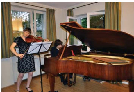
Koncert muzyki kameralnej