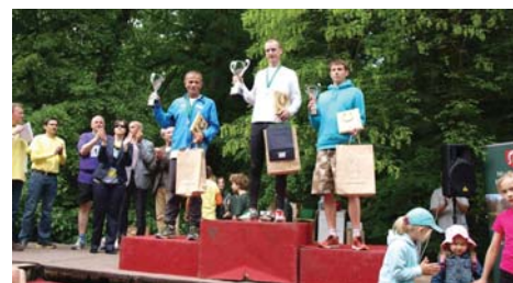
Dekoracja zwycięzców biegu głównego I Podkowińskiej Dychy