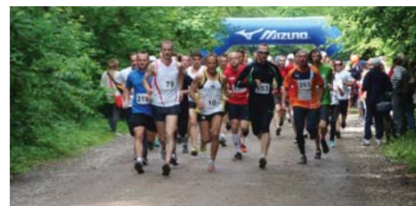
Start biegu głównego I Podkowińskiej Dychy