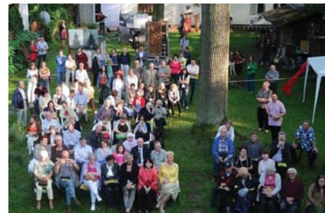
„Ogród - Przestrzeń - Zmysły”