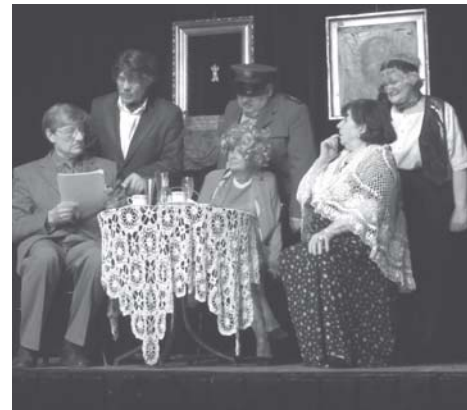
fol. T. Potkański