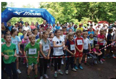
Start biegu na 400 metrów dzieci kategoria 4-10 lat