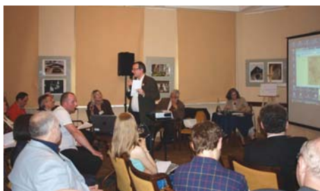
Konferencja „Wyszehrad w Otwartych Ogrodach Podkowy Leśnej”