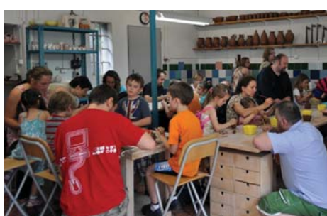
Rodzinne zabawy z gliną