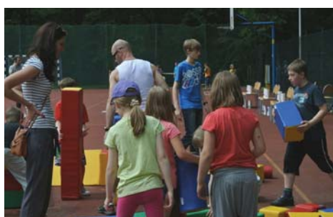
„Wejź do gry” – ogród szkolny