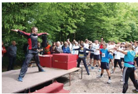
Rozgrzewka przed biegiem na 10 km, prowadzenie instruktor Gravitan Health and Sport Clubs