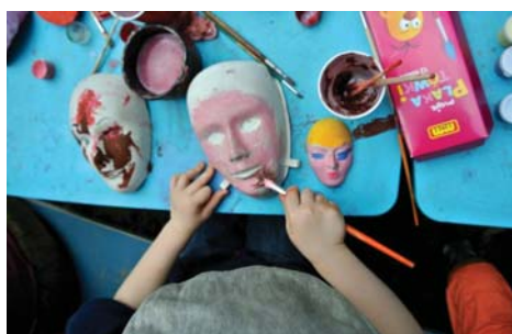
Dziecięcy ogród teatralny