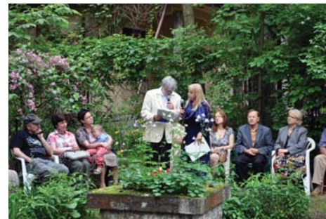
„Pierwszy taki zajazd na Lipowej”