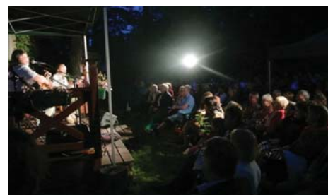
Koncert szantowo- balladowo-kameralny