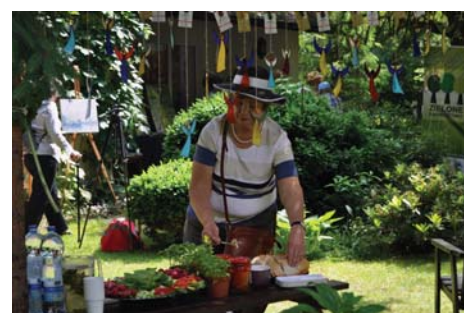
„Ekoherbatka jak u szalonego Kapelusznika”