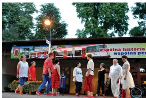
„Kto za kolejką tą stoi?” - spektakl teatru ruchu w wykonaniu mieszkańców Podkowy, Milanówka i Brwinowa