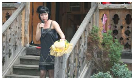
Ogród „Aidy” – koncert piosenek Zuli Pogorzelskiej