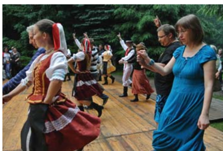
Potańcówka na dachach przy muzyce słowackiej kapeli „Sedličan”