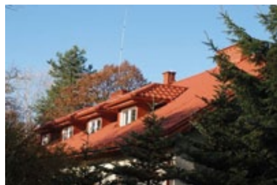
Nowy dach na budynku Urzędu Miasta