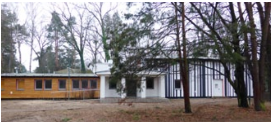
Wyremontowany budynek CKiIO przy ul. Świerkowej 1

Beata Piotrowska Referat Gospodarki Miejskiej