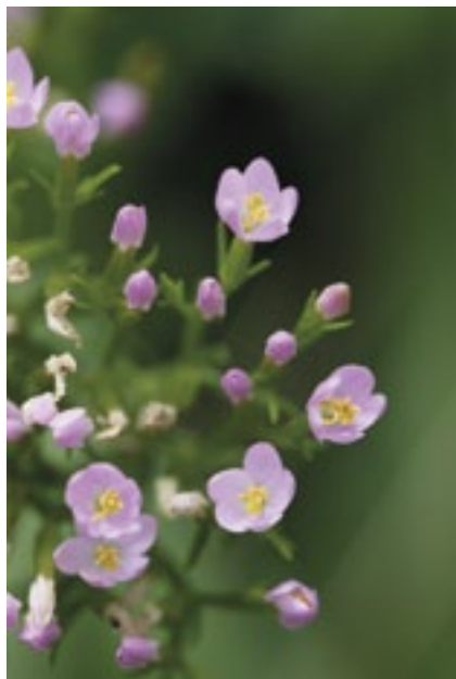
Centuria pospolita

i sadzonki wielu chronionych gatunków. Dobrze znane i chętnie sadzone w ogrodach i parkach cisy, naparstnice, bluszcz, sasanki, pierwiosniki, dyptam, lilia złotogłów, dziurawiec, jarząb szwedzki (krewny jarzębiny), powojnik prosty, by wymienić najbardziej popularne, są prawnie chronione jeśli rosną dziko. Zamiast zbierać je w lesie, co z reguły prowadzi do zniszczenia naturalnego siedliska, posadźmy te gatunki u siebie. Natomiast na spacerze po Podkowie powstrzymajmy się od zbierania lub niszczenia jakichkolwiek roślin. Nigdy nie wiadomo, czy kępa mchu, jaką mamy zamiar rozdeptać, nie jest właśnie jednym z tych 137 prawnie chronionych gatunków.