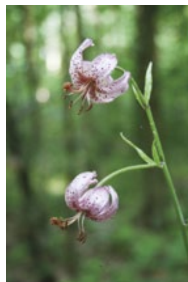
Lilia złotogłów

Wśród gatunków objętych ochroną znajdują się także te, które dobrze znamy i które stanowią przedmiot handlu, np. konwalia. Konwalia dostępne w sprzedaży pochodzą z upraw. Prawo nie zabrania uprawy roślin chronionych, a w sklepach i firmach ogrodniczych można absolutnie legalnie nabyć nasiona