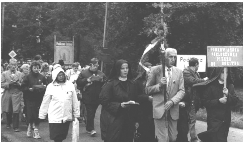
Pierwsza Pielgrzymka w 1988 roku