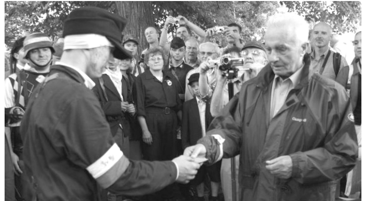
Wręczenie legitymacji AK dla Kuby przez najstarszego stopniem, żyjącego powstańca z Mokotowa