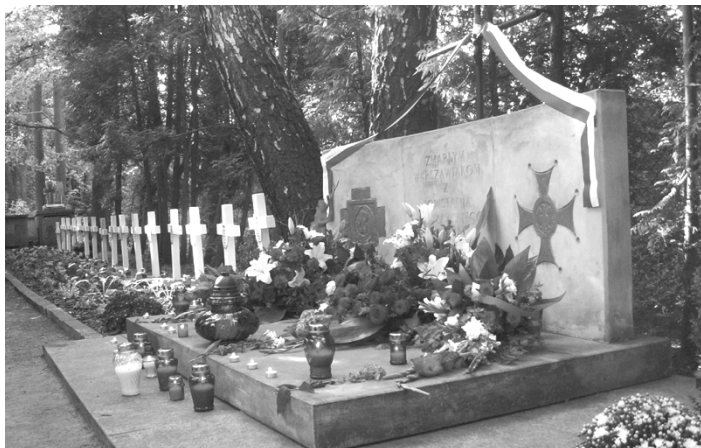
Groby powstańcze na cmentarzu w Podkowie Leśnej

W piątek 1 sierpnia 2008 r. przy grobach powstańczych na cmentarzu w Podkowie spotkali się mieszkańcy miasta - wśród nich grupa kombatantów, przedstawiciele Rady i Urzędu Miasta, a także instytucji oraz organizacji społecznych. O godz. 17.00 zebrani chwilą ciszy uczcili pamięć uczestników Powstania i złożyli kwiaty pod tablicą z napisem: Zmarłym warszawiakom z Powstania Warszawskiego.