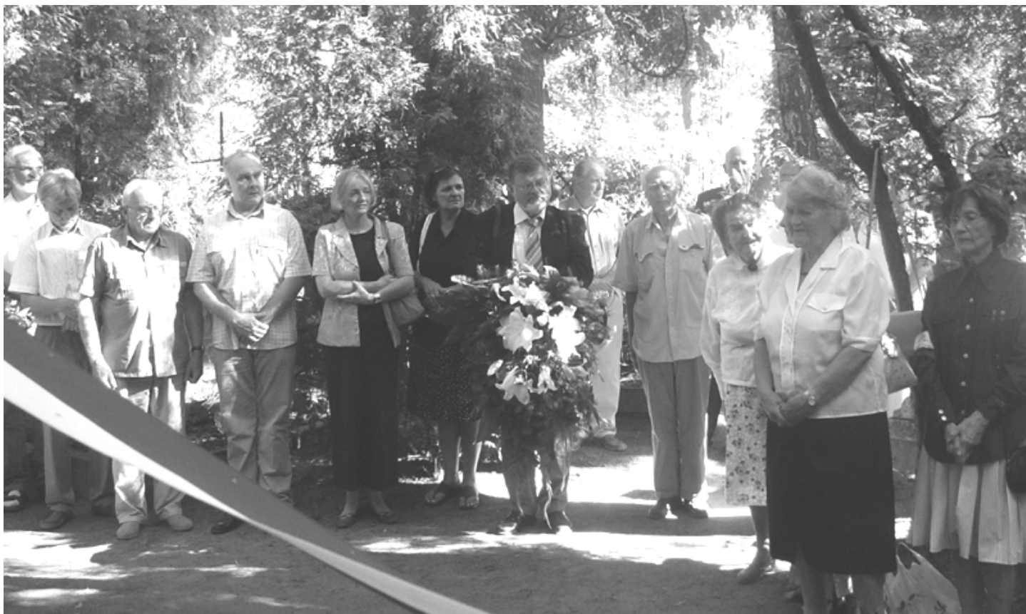
64. rocznica wybuchu Powstania Warszawskiego, cmentarz w Podkowie Leśnej