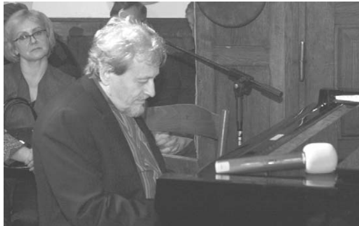
16.11.2008 Stawisko Koncert Adama Makowicza n/z Adam Makowicz