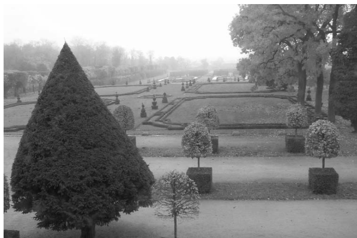
fol. A. Maziarska