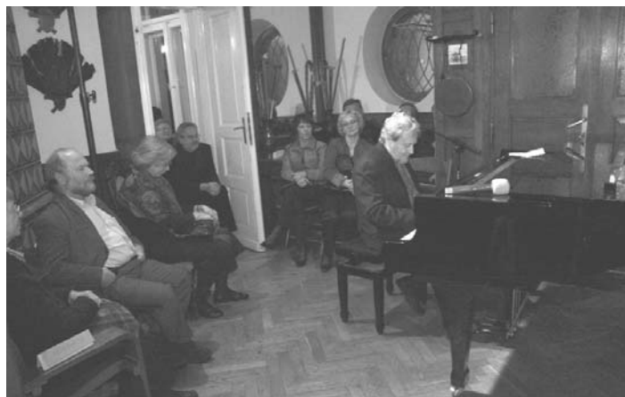
16.11.2008 Stawisko Koncert Adama Makowicza n/z Adam Makowicz