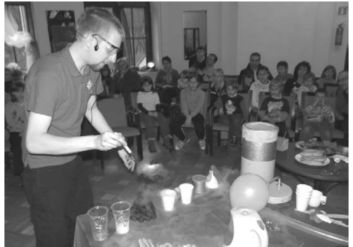
fol. O. Lewan

Mieliśmy szansę zaobserwować płynne powietrze! Azot przechodzący w stan gazowy powodował spektakularne wybuchy, które budziły wielki entuzjazm wśród młodej publiczności oraz salwy oklasków. Naukowcy pokazali dzieciom, że można "usmażyć" jajko sadzone na ciekłym azocie, oraz "ugotować" zwykłego banana w ciekłym azocie, a owoc po tej kąpieli staje się twardy i kruchy jak szkło.