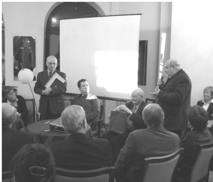
fol. T. Potkański