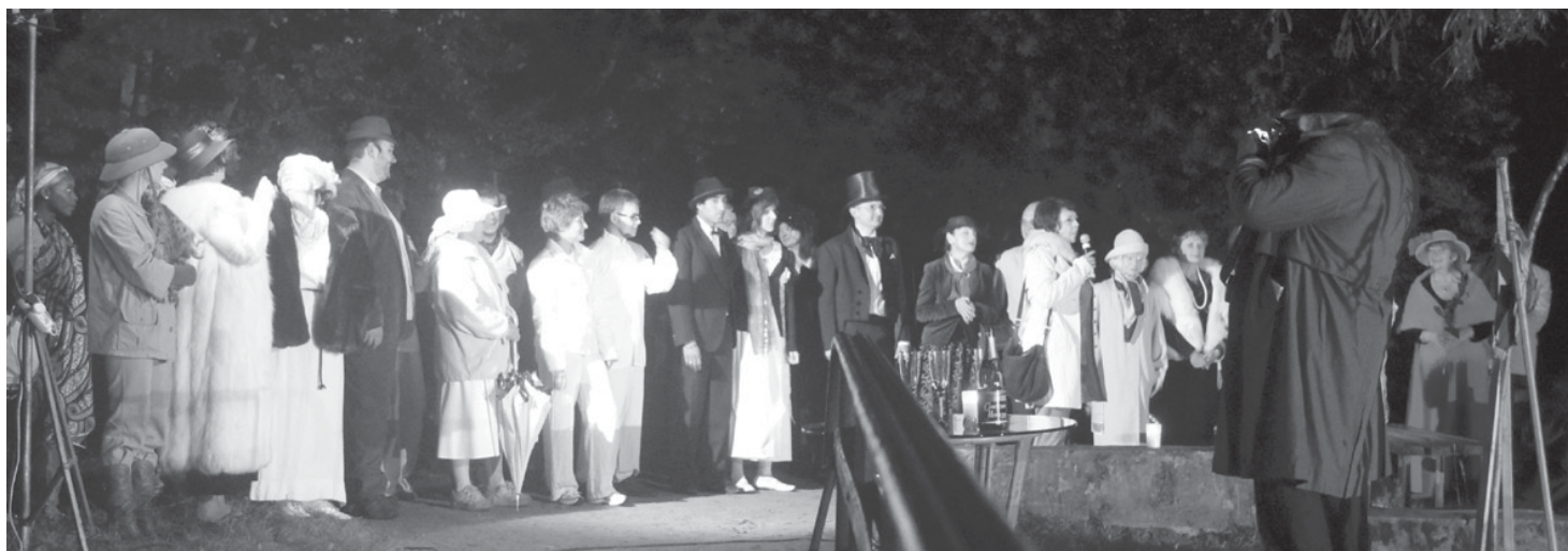
Spektakl „Dżentelmen i Spółka”

Miejsce: nad stawem w Parku Miejskim, ul. Lilpopa, organizator: CKiIO