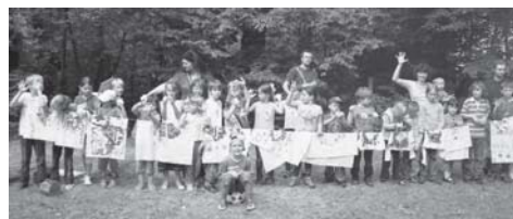
A oto jak bawiliśmy się w lipcu 2010...

ne, organizacje pozarządowe i instytucje. Mieszkańców Owczarni ucieszy zapewne plan budowy świetlicy w ich miejscowości. Burmistrz Gminy Brwinów zaplanował tę inwestycję w ramach działania „Odnowa i rozwój wsi”. Podkowa złożyła wniosek na „System Informacji Miejskiej”.