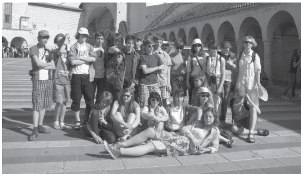
Klasa 1g w Asyżu

W marcu i kwietniu kontynuowano roboty wykończeniowe wewnątrz budynku. Wykonano tynki i wylano posadzki. Prace przy instalacjach elektrycznej i wentylacyjnej są na ukończeniu. Aktualnie montowane są drzwi-witryny wejściowe i w korytarzach. W tych dniach (połowa maja) nastąpiło połączenie sali gimnastycznej z nową częścią. Rozpoczęto też wykańczanie łazienek. Pozostają prace związane z położeniem wykładzin, malowanie i końcówka prac elewacyjnych. Mamy nadzieję rozpocząć nowy rok szkolny w nowym budynku.