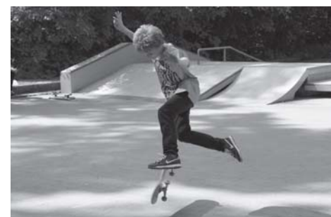
fol. J. Walc