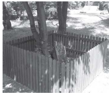
Mrowisko przed i po zabezpieczeniu