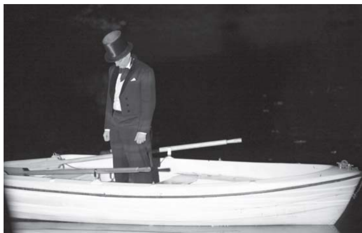
Spektakl „Dżentelmen i Spółka”, fot. Jacek Tomaszewski

Miejsce: Galeria Kasyno, ul. Lilpopa 18, organizator: CKiIO