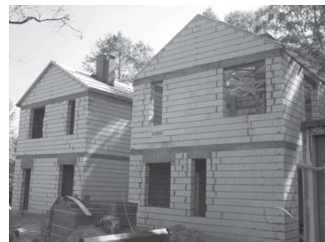
fol. H. Stefankiewicz