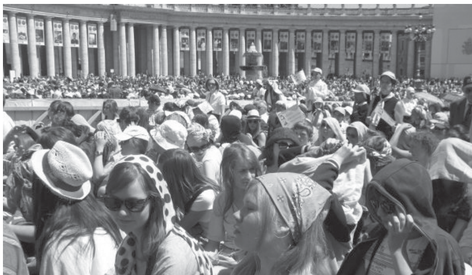
Audycja, 11 maja 2011

W Rzymie uczestniczyliśmy w audyencji papieskiej, zostaliśmy wyczytani wśród obecnych na placu św. Piotra i głośnym entuzjastycznym krzykiem skupiliśmy na sobie uwagę telewizyjnych kamer. Mieliśmy flagę z nazwą naszego gimnazjum i byliśmy zwyczajnie dumni i szczęśliwi, że jesteśmy wśród tylu pielgrzymów z całego świata. Zobaczyliśmy to, co zobaczyć zdążyliśmy, czyli Muzea Watykańskie, Rzym Starożytny i Rzym Barokowy. Mogliśmy też pomodlić