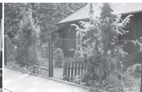
Ogrodzenie przed „Zabytkiem” przed i po usunięciu reklam