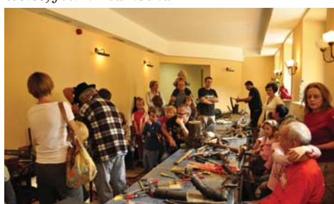
Rodzinne warsztaty rzeźbiarskie pod kierunkiem Józefa Wilkonia