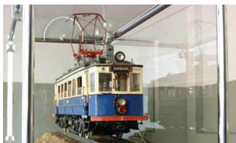
Niewielka kolejka wielkich idei: Wystawa, prezentacja makiet kolejki WKD, opowieść o historii kolejki, prezentacja historycznych zdjęć, warsztaty modelarskie, plener malarski, fot. J. Miszcza.