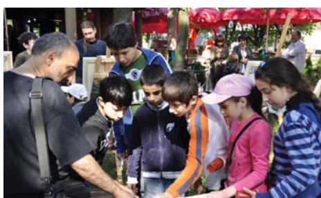
Plener malarski pt. „Podróż” z udziałem dzieci ze szkół podkowieńskich i dzieci z Ośrodka UdsC w Dębaku