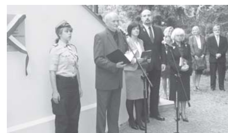
fol. O. Koszutski