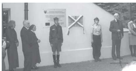
fol. P. Jakubiak