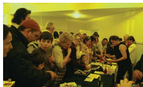
Podkowieński Produkt Lokalny, fot. O. Koszutski