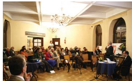
Debata nt. cywilizacyjnej roli transportu publicznego