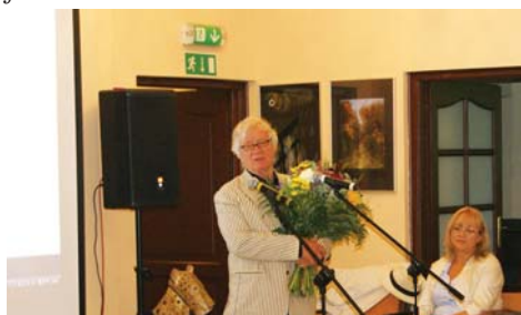
Wernisaż wystawy rzeźb i ilustracji Józefa Wilkonia