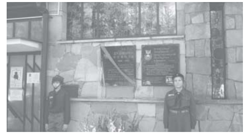
al fot. A. Lorens

W uroczystościach udział wzięli licznie zgromadzeni podkowieanie, grupa starszych i młodych harcerek oraz harcerzy, duchowni i przedstawiciele władz miasta.