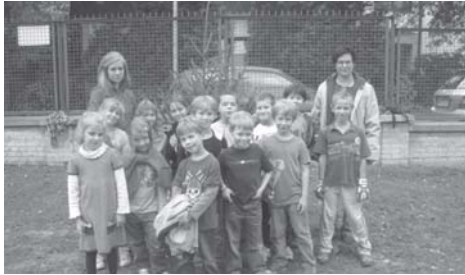
Pierwszoklasiści Szkoły św. Teresy przed „swoim” świerkiem

W piątek, 14 października świętowaliśmy Dzień Edukacji Narodowej. Rano msza św., dalej uroczystość ślubowania nowych uczniów w MOK-u. Zazwyczaj byli to uczniowie jedynie kl. 1, ale tym razem grono poszerzyło się o nowych uczniów klas starszych. W sumie ponad 60 osób. Program artystyczny przygotowali pierwszoklasiści z klasy 1a-sześcioletków i klasy 1b-siedmiolatek. Po tem każdy był pasowany na ucznia dużym, czerwonym ołówkiem, osobiście przez Pana Dyrektora. Poczęstunek w klasach zakończył ten wyjątkowy dzień. Miłą pamiątką tej uroczystości był nowy zwyczaj sadzenia drzewek przez klasy pierwsze.