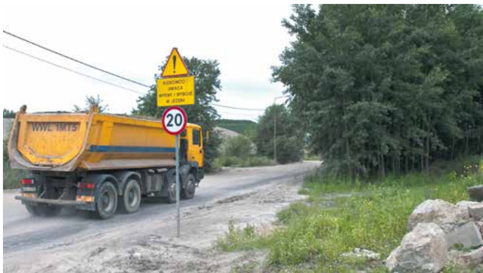
* Drogi prowadzące do autostrady zostaną naprawione