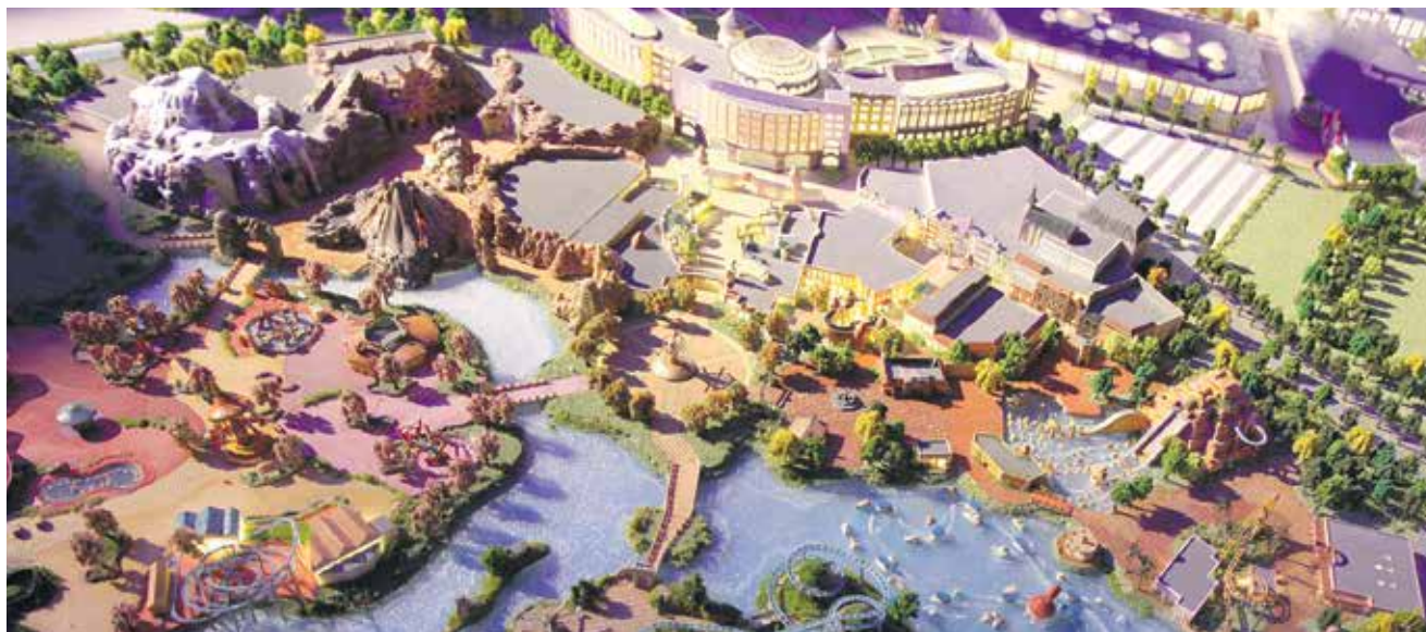
* Tak ma wyglądać Adventure World Warsaw. Park będzie podzielony na kilka stref tematycznych