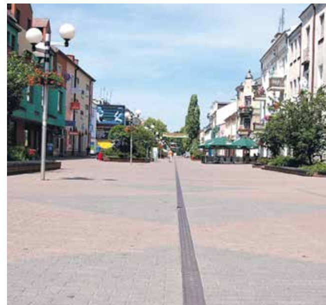
* Grodzisk powtórzył lokatę sprzed roku

W pierwszej setce żadnego z wymienionych rankingów nie znalazły się pozostałe miejscowości z powiatów pruszkowskiego i grodziskiego. * (AF)