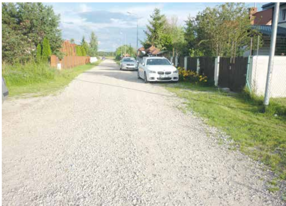
* Ulica Łoniewskiego w Kajetanach będzie zmodernizowana

Władze Nadarzyna podjęły więc decyzję o przebudowie obu ulic. Nie wiadomo jeszcze, kiedy prace