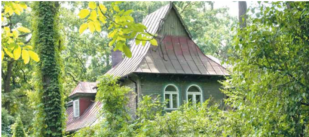
* Willa Jókawa jest jednym z najstarszych budynków w Podkowie. Powstała w 1928 roku