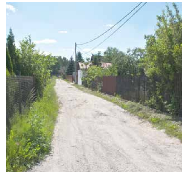
* O utwardzenie tej drogi walczy mieszkanka Kajetan