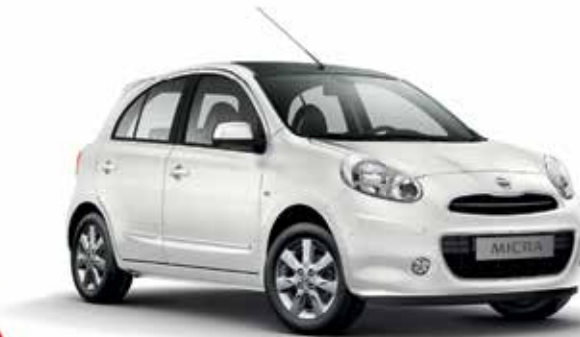
NISSAN MICRA OD 33 590 ZŁ