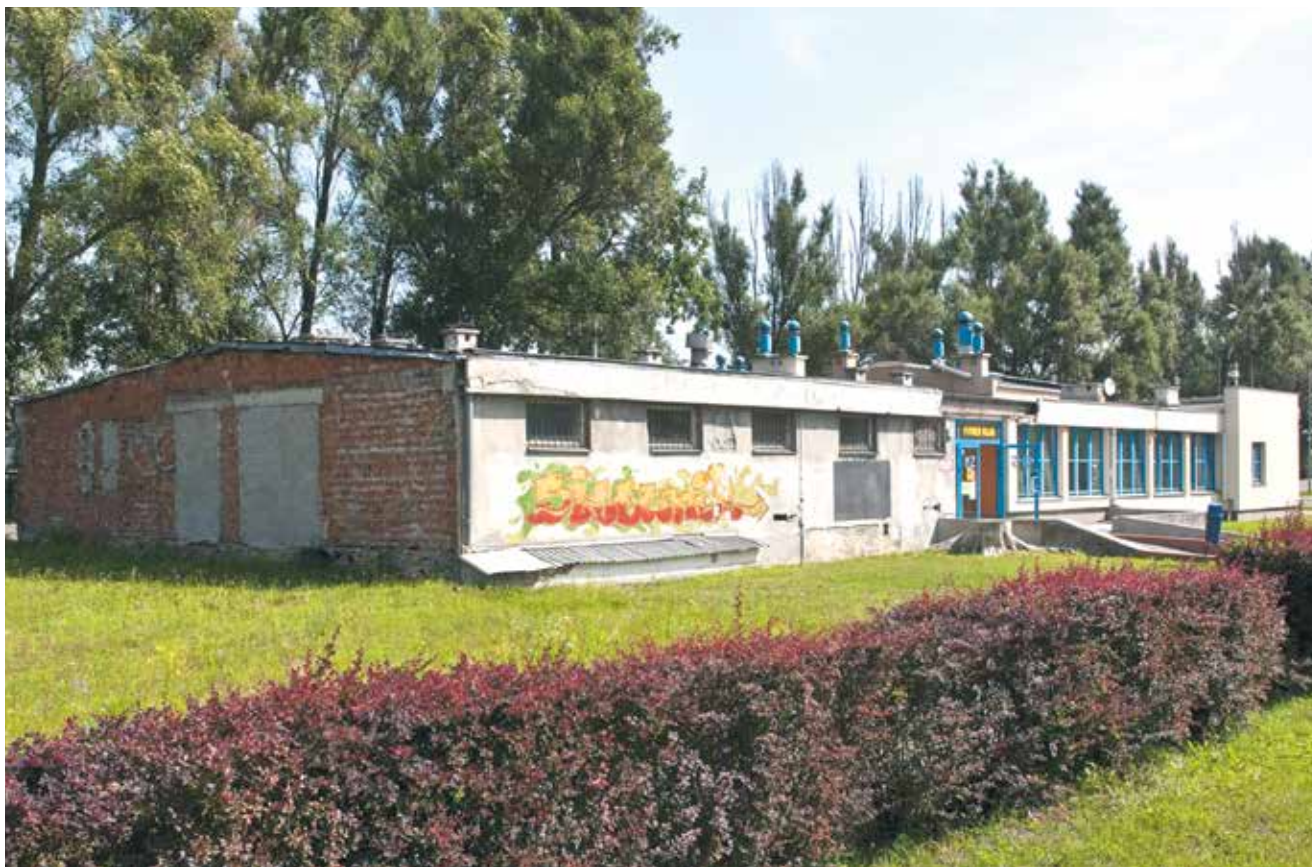
★ Centrum Dziedzictwa Kulturowego powstanie w miejscu m.in. tego budynku

Centrum Dziedzictwa Kulturowego stanie na terenie kompleksu sportowego Znicza