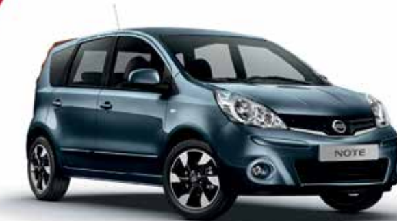
NISSAN NOTE OD 39 990 ZŁ