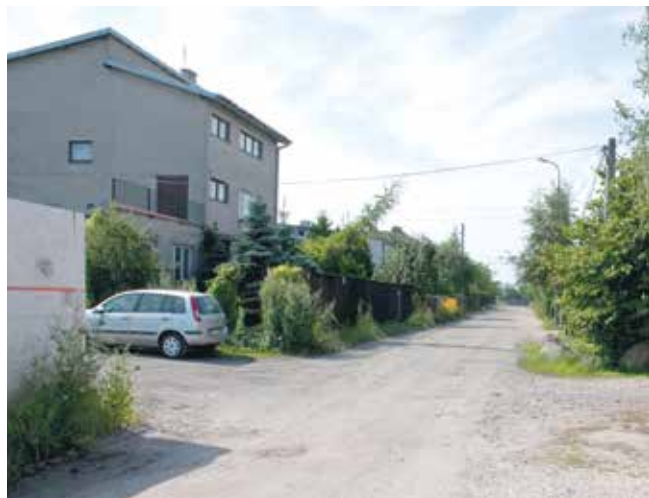
* Remont drogi ma się zakończyć do 30 listopada tego roku

Ul. Miernicza przebiega z południa od skrzyżowania z ul. Broniewskiego na północ do terenu nowo budowanego osiedla „Aleja Róż”. Na odcinku objętym modernizacją droga usytuowana jest w obszarze zabudowy jednorodzinnej i korzystają z niej głównie okoliczni mieszkańcy. Szerokość drogi wynosi ok. 8,5 m. Jej nawierzchnia jest gruntowa, wzmocniona kruszywem łamanym. Lattarnie uliczne oświetlają ulicę po obu stronach. Na wskazanym odcinku znajdują